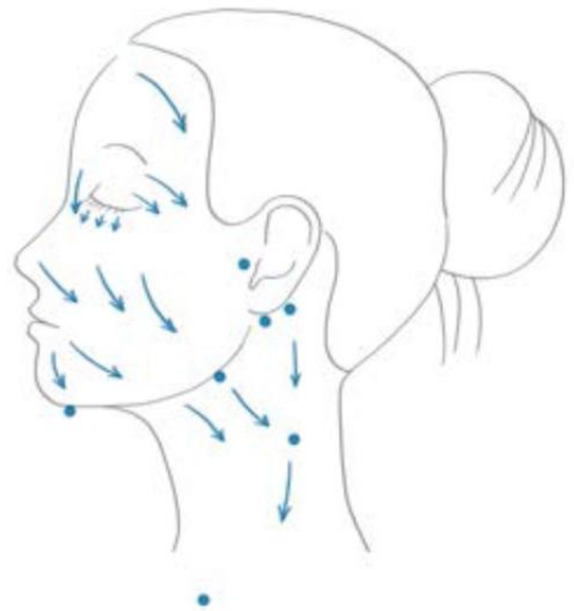
Grafik/Illustration: Mascha Greune, München